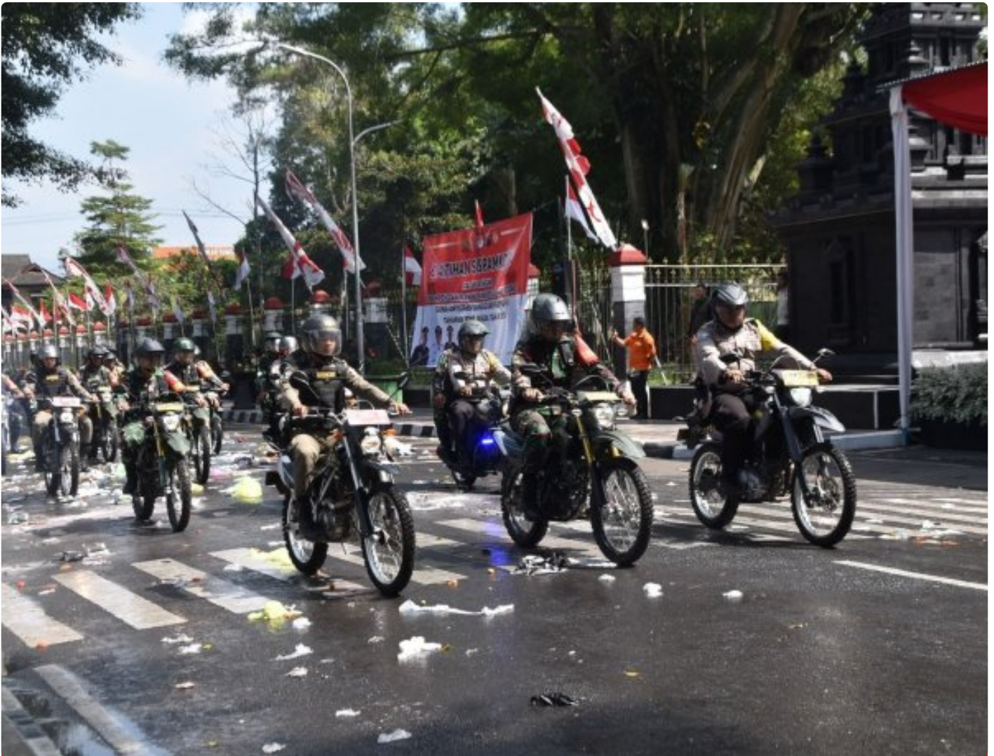
Foto: Kegiatan Kodim 0707/Wonosobo bersama Polres Wonosobo mengadakan latihan bersama Sistem Pengamanan Kota (Sispamkota) di Alun-alun Wonosobo, Jawa Tengah, Rabu (21/08/2024).